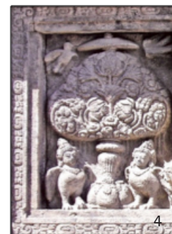
3 Reliëf entree voormalige zijvleugel Ministerie van Koloniën, Binnenhof 7. 4 Oorspronkelijk reliëf in het Prambanan tempelcomplex op Java, ca. 850 na Chr.