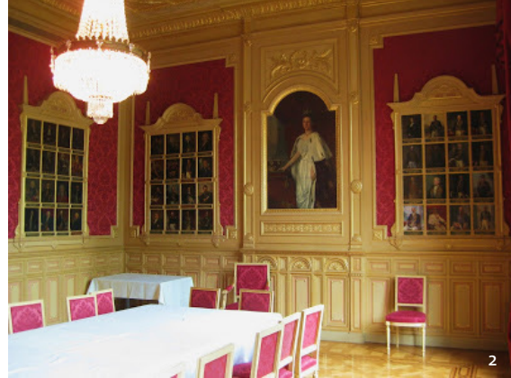
1 Voormalig ministerie van Koloniën (Foto: Kroon & Wagtberg Hansen) 2 Voormalige kamer van de minister van Koloniën (Regentenkamer). In de kamer van de minister, de zogeheten Regentenkamer, hangen de 66 portretten van alle gouverneurs-generaals van Nederlands-Indië. (Foto: Kroon & Wagtberg Hansen)

Verder speelde het departement, samen met de ministeries van Marine en Oorlog, een rol bij de verdediging/defensie van de koloniën en met name de verscheping van militair personeel naar deze gebieden.